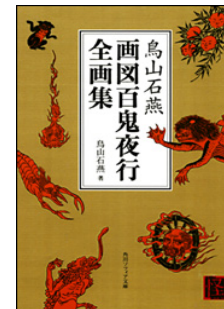
とりやま せきえん

妖怪フィギュアに係る模型原型は、石燕の「画図百鬼夜行」を原画とするものと、そうでないもののいずれにおいても、一定の美的感覚を備えた一般人を基準に、純粹美術と同視し得る程度の美的創作性を具備していると評価されるものと認められるから、 応用美術の著作物に該当する というのが相当である。