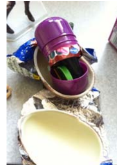
16 大阪高判H17/7/28 海洋堂フィギュア事件