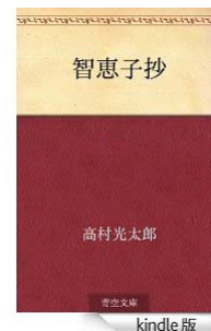
智恵子抄 [Kindle版] 高村 光太郎 (著) Kindle 価格: ¥ 0

そうすると、仮に光太郎以外の者が「智恵子抄」の編集に関与した事実があるとしても、格別の事情の存しない限り、光太郎自らもその編集に携わった事実が推認されるものであり、したがって、その編集著作権が、光太郎以外の編集に関与した者に帰属するのは、極めて限られた場合にしか想定されないというべきである。